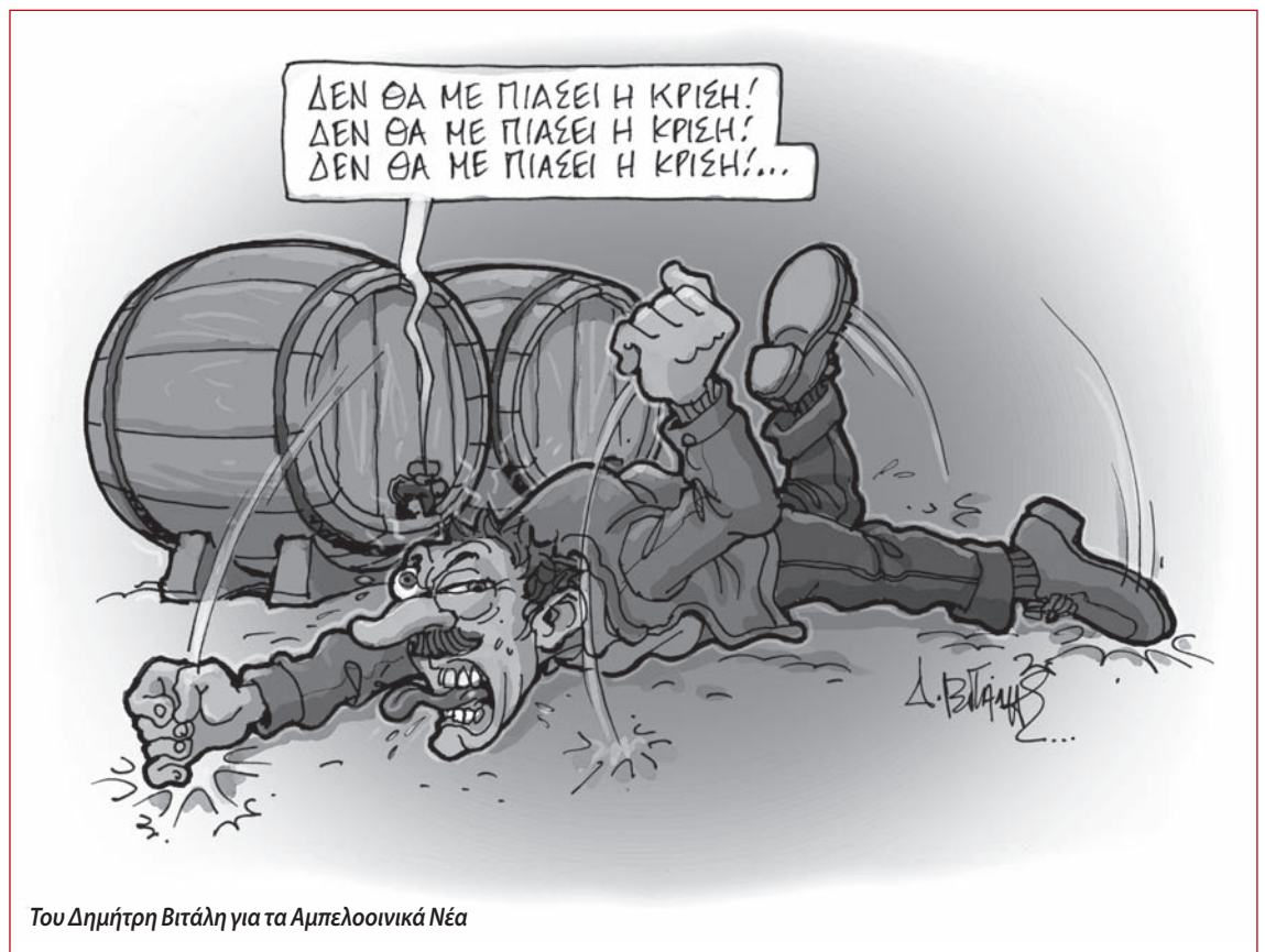
Του Δημήτρη Βιτάλη για τα Αμπελοοινικά Νέα

αξιοπρεπές επίπεδο και εφαρμογή του μέτρου των εκριζώσεων δίχως